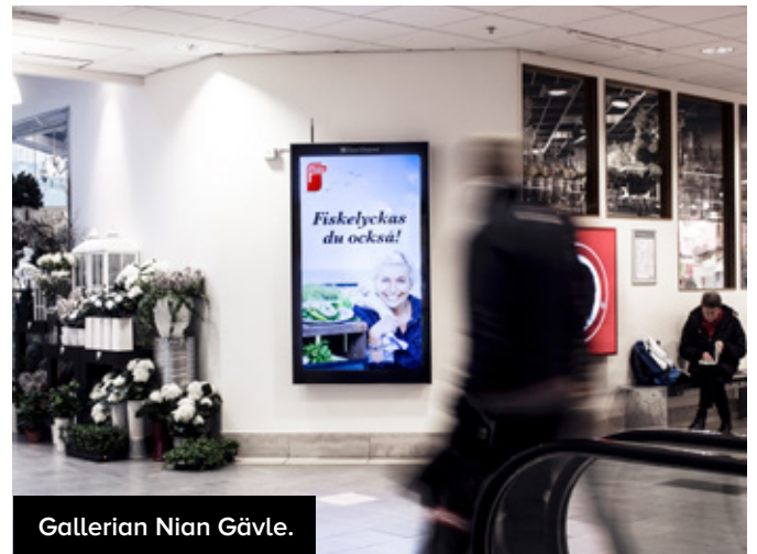
Gallerian Nian Gävle.