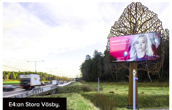
E4:an Stora Väsby.