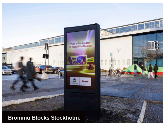
Bromma Blocks Stockholm.