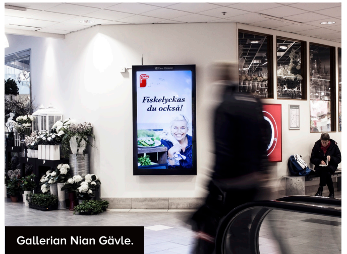
Gallerian Nian Gävle.